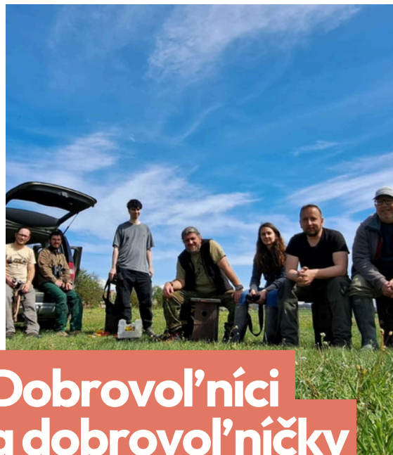
Dobrovol'níci a dobrovol'níčky SOS/BirdLife Slovensko